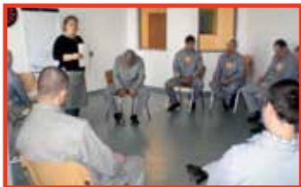
Képek a 3. oldalról...