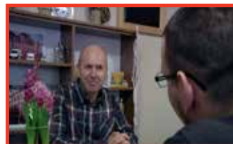
Képek a 6. oldalról...