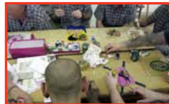
Képek a 7. oldalról...